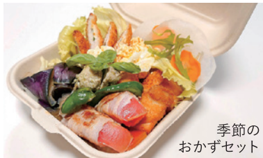
季節のおかずセット