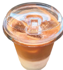
カフェラテ(アイス)