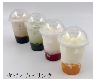
タピオカドリンク