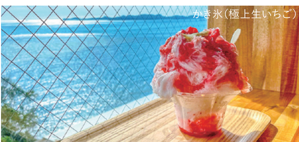
かき氷(極上生いちご)