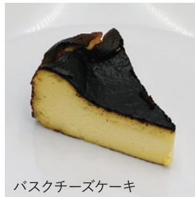
バスクチーズケーキ