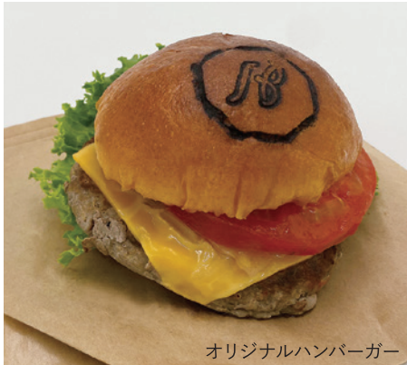
オリジナルハンバーガー